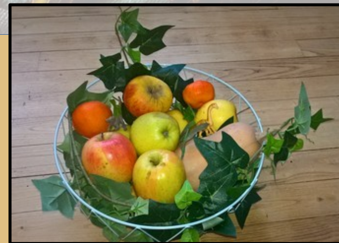
Nature morte 2 Fruits et légumes frais. Feuillage en plastique, dans sa corbeille moderne.