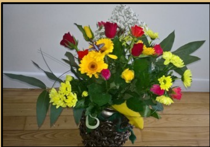
Nature morte 3 Fleurs et feuillages naturels. Fruit en plastique, dans son vase en céramique.