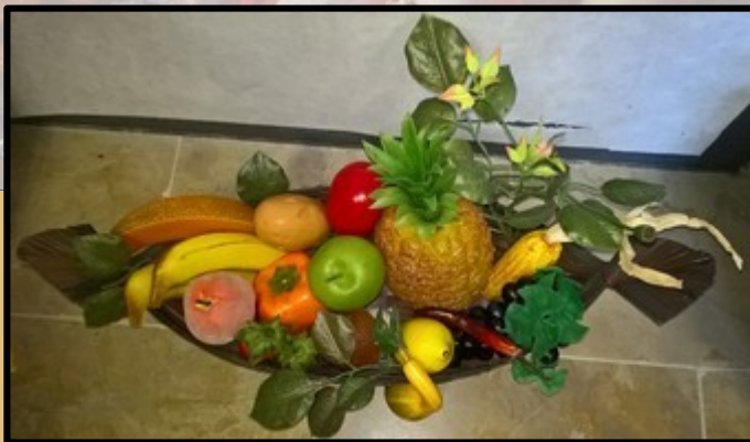
Nature morte 1 Fruits, légumes et feuillages en plastique dans sa corbeille en osier.

Quatre animaux se sont cachés dans les natures mortes. Sauras-tu les retrouver ?