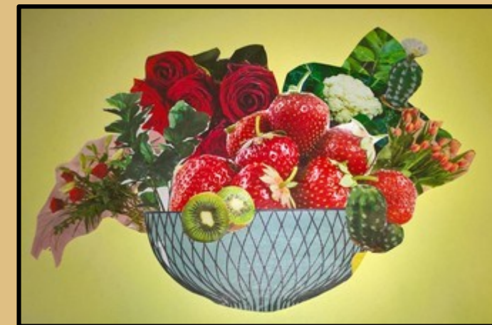
Nature morte 4 Fleurs, fruits et feuillages imprimés, dans sa corbeille en papier.